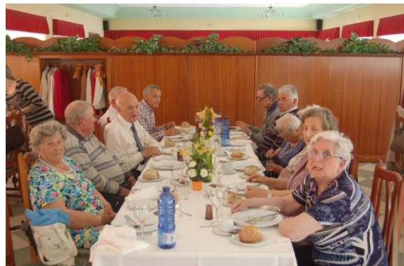
Empezando el banquete