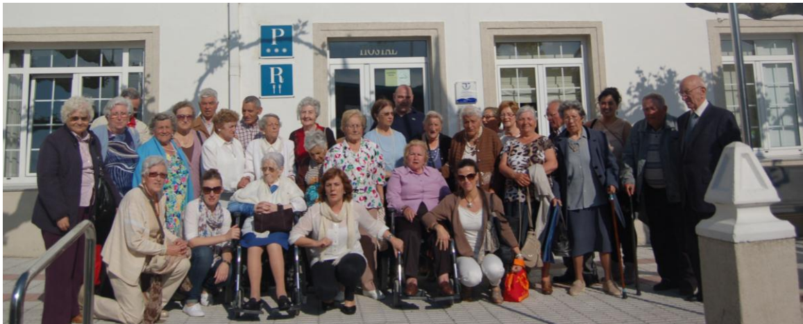
Foto de grupo delante del restaurante A Casilla

Continuamos la excursión en el restaurante A Casilla en Guitiriz, donde comimos estupendamente. Una vez terminamos de comer empezó la música y entre baile y baile pasamos una tarde muy animada