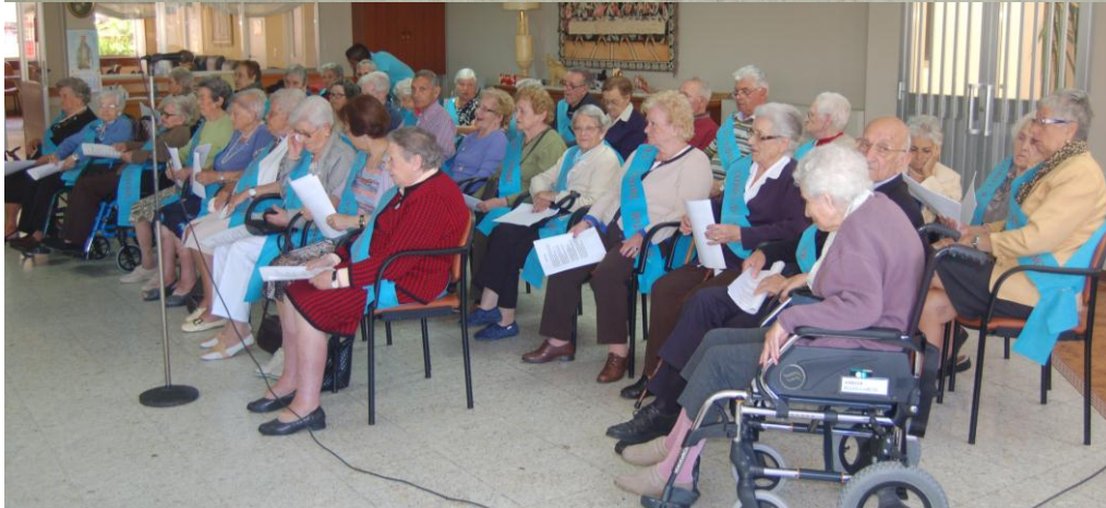
Día de las familias. Actuación del coro.