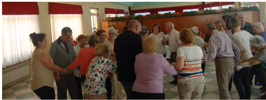
Momentos de la tarde de baile