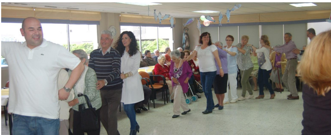
Residentes y trabajadores en el baile de la fiesta de San Juan